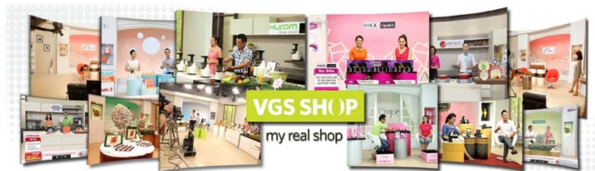
TVショッピングサイト「VGS SHOP」

以上のようなお互いの強みを活かし、日本企業のベトナムでのEC販売及びオフライン販売を支援していくことでシナジー効果を発揮できると判断し、業務提携を行うことにいたしました。